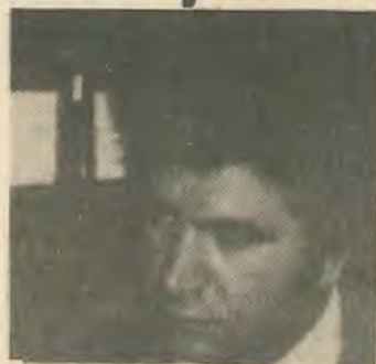
Βουλευτής της ΕΔΕΚ πριν γίνει μέλος